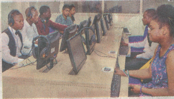
• एफओएसएस लैब में सॉफ्टवेयर की बारीकियां सीखते स्टूडेंट्स।